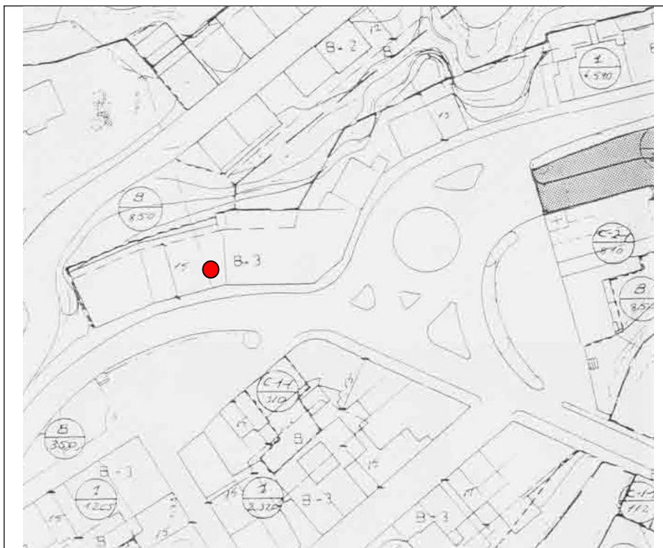
Plànol 2.5. NN.SS. Sòl urbà .delimitació , zonificació , sistemes generals i locals nucli urbà de Guardiola de Berguedà .

12) Amb independències del expressat en els articles anteriors, sempre que per circumstàncies d'ocupació d'illa, muntats de fet en l'edificació de la mateixa, es considera que puguin ser millorades les condicions urbanístiques al objecte de l'obtenció de espais lliures, dotacions o equipaments que ajudin a eixugar els dèficits existents en tal manera o sector, l'Ajuntament bé d'ofici o bé al sol·licitar-se qualsevol petició de llicència en aquestes illes o sectors podrà adoptar la resolució de que es procedeixi a projectes especials de reforma interior l'obtenció d'aquelles finalitats.