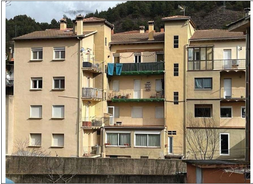
Fotografia façana lateral a refer balcons exteriors