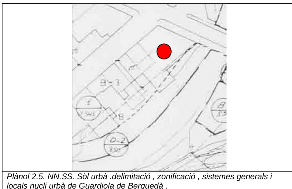
Plànol 2.5. NN.SS. Sòl urbà .delimitació , zonificació , sistemes generals i locals nucli urbà de Guardiola de Berguedà .

Actualment s'està redactant un nou POUM a Guardiola de Berguedà ,que es troba aprovat inicialment des del desembre del 2013, i que a dia d'avui es troba pendent de l'aprovació provisional i definitiva.